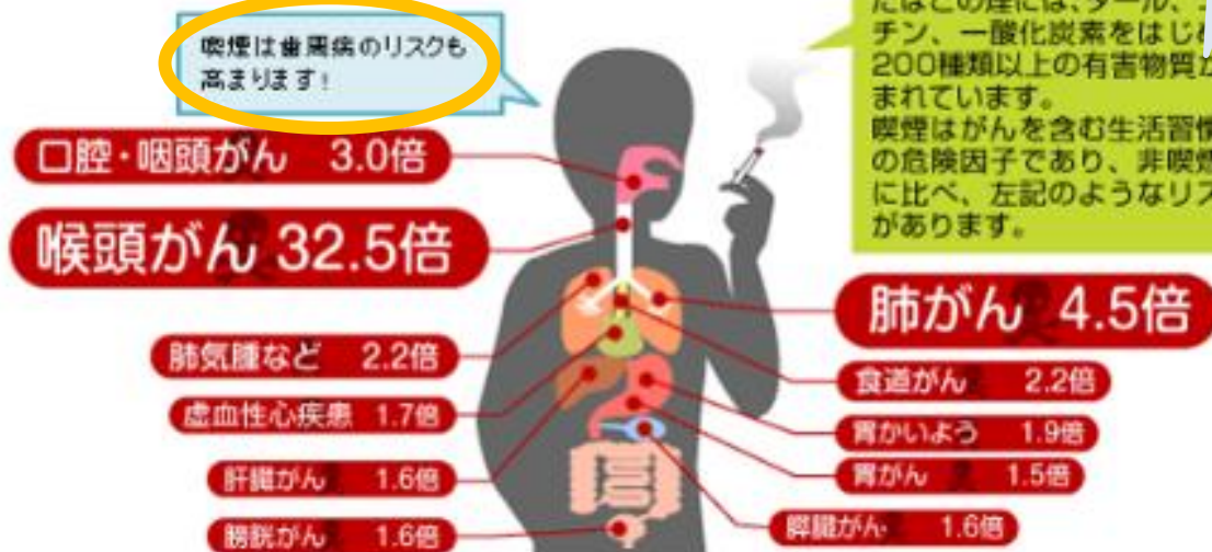
非喫煙者と比較した喫煙者の死亡率(%) ~男